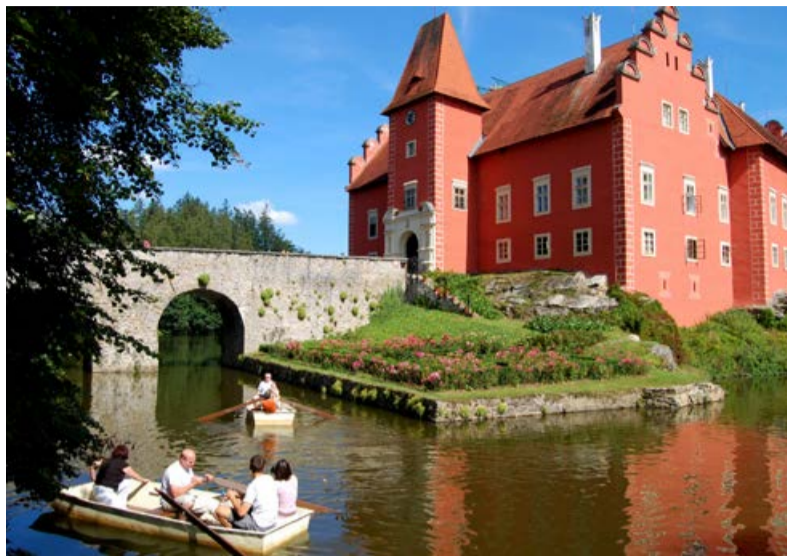
Název místa fotky. Popis Fotky popis fotky pois fotky.

Nechte se vtáhnout a užijte si pohádkový výlet. Romantická procházka zámeckým parkem, návštěva zámku a seznámit se s historií této vodní tvrze. Nebudete litovat. Malá Hluboká, i tak je nazýván zámek v Českém Rudolci. Budova zámku je poznamenána ne příliš příznivou historií, ale i přesto vás zámek zaujme. Průvodci vás rádi seznámí s historií, který zámek zažil. V blízkosti zámku se nachází zájezdní hostinec s vlastním pivovarem.