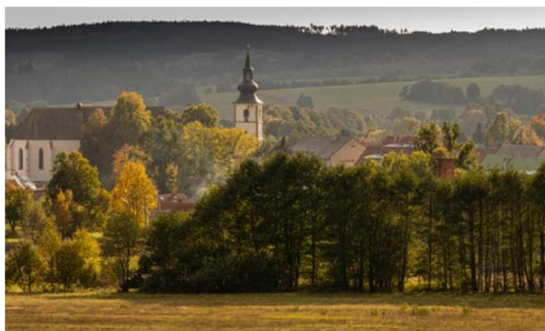
Staré Město pod Landštejnem.

trojmezí Čech, Moravy a Rakouska. V blízkosti městyse najdete také nově opravený zámek Dobrohoř. Z města se také můžete pěšky vydat na hrad Landštejn, nebo objevovat přírodní krásy Hadiho vrchu.