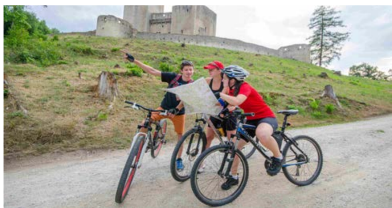
Cyklisté u hradu Landštejn.

Snímky z putování Stežkou Českou Kanadou na sociálních sítích označujeme: #stezkaceskoukanadou Těšíme se i na vaše fotografie s tímto hashtagem.