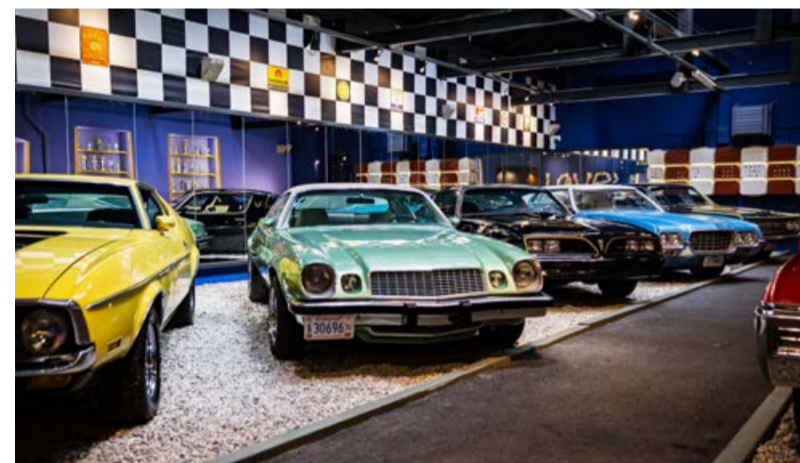
Muzeum veteránů každoročně překvapí novou expozicí.