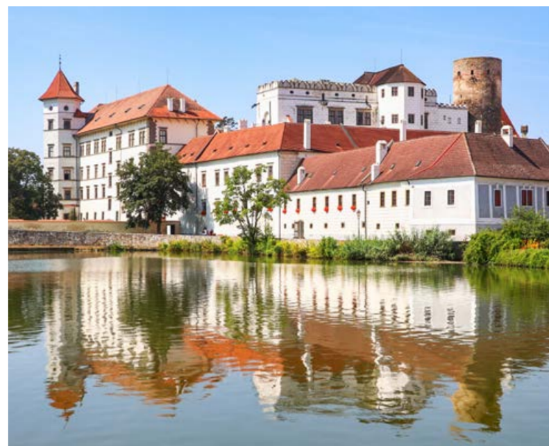
Pohled na zámek Jindřichův Hradec přes rybník Vajgar.