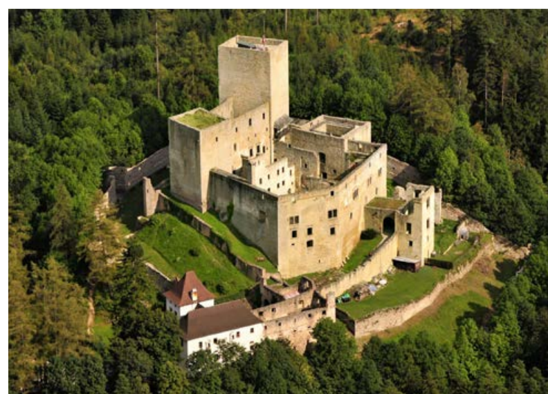
Hrad Landštejn. Dominanta, která krajinu střeží již několik století.

www.zamek-jindrichuvhradec.cz www.zamek-cervenalhota.cz www.zamek-dacice.cz www.hrad-landstejn.cz