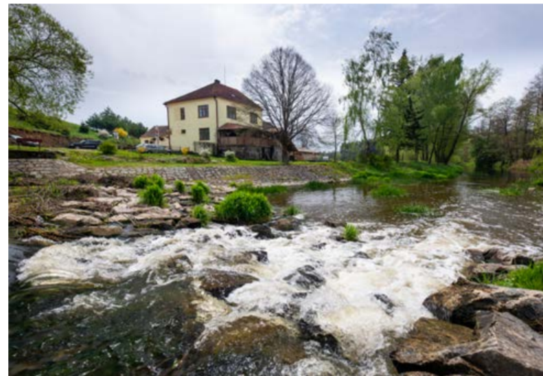
Název místa fotky. Popis fotky popis fotky popis fotky.

Empírovou hrobku rodu Collatů (původních majitelů zámku v Písečném) z roku 1824 můžete obdivovat v nedalekých Nových Sadech. Autentickou náves Nových Sadů si zvolili filmaři pro natočení některých scén filmu Po strništi bos.