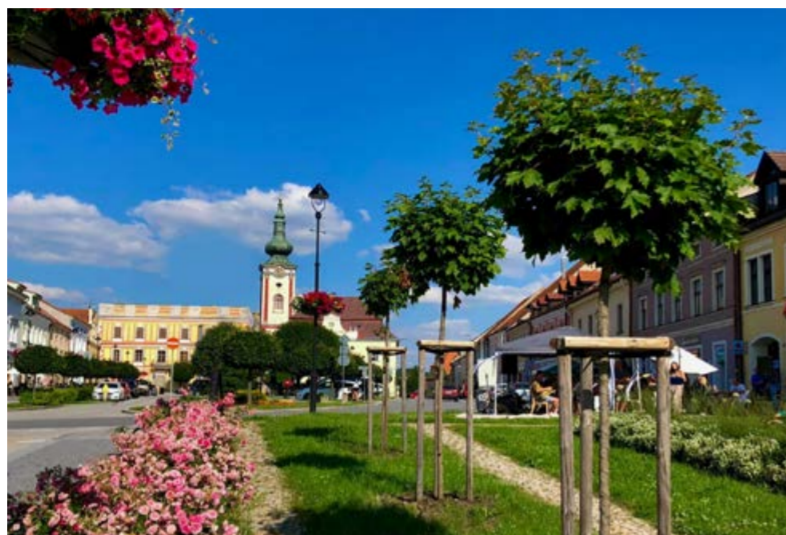
Nová Bystřice. Brána České Kanady.