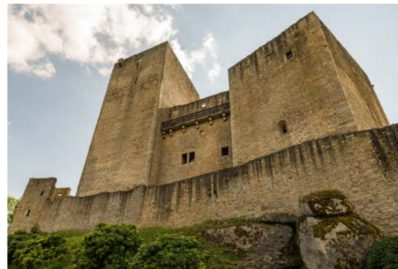
Hrad Landštejn. Pohled na strážně věže.