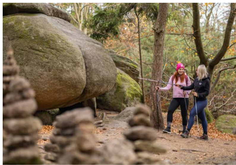
Skalní útvar Ďáblova prdel . Nejvyhledávanější balvan České Kanady.