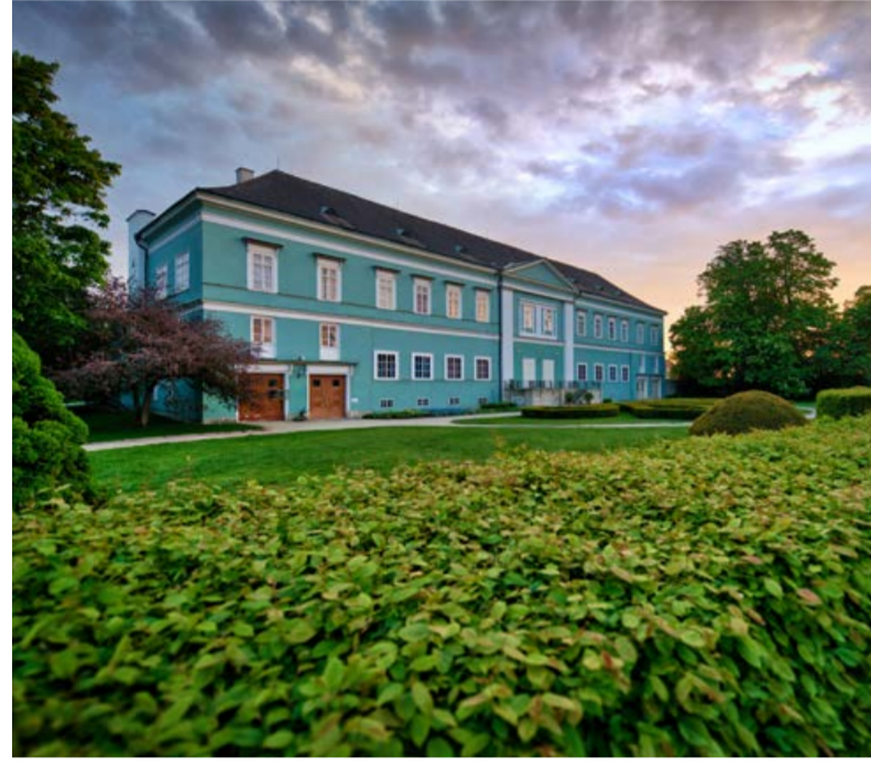
Státní zámek Dačice. Uvnitř zámku najdete nejen skvost. Autor: Vojtěch Lajka

V Dačicích objevíte malý žulový pomník kostky cukru nedaleko centra. V roce 1843 zde totiž byla vyrobena první kostka cukru na světě.