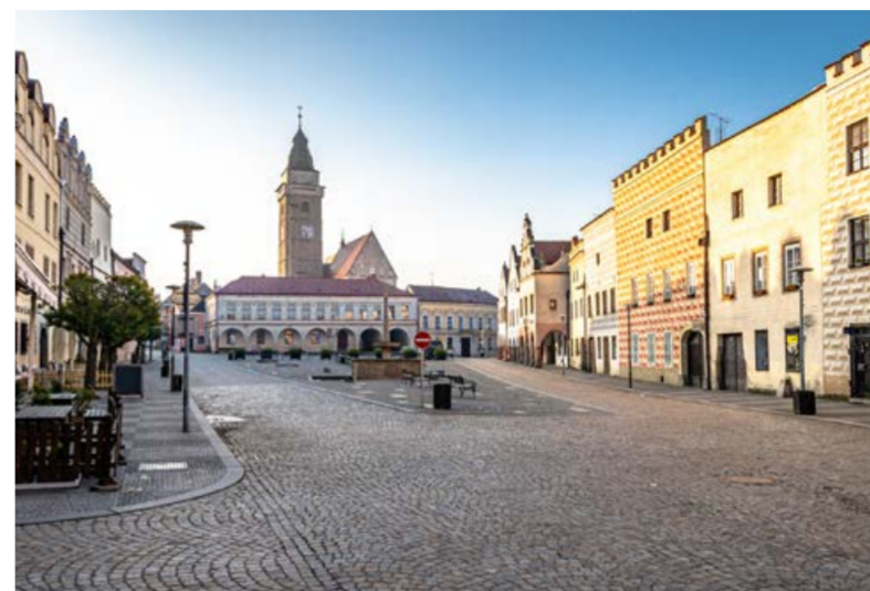
Slavonické náměstí. Renaissance perla České Kanady.

Pozoruhodné dochované pozdně gotické a renesanční domy na obou náměstích, jejich vzácné sgrafitové fasády, freskové scény a složité skřípkové klenby v interiérech vás vtáhnou zpět v čase. Luteránská modlitebna v domě U Giordanů s výjev z bible ve vás zanechají nezapomenutelné pocity. Dobrodružství zažijete v podzemních chodbách, protínající jednu stranu náměstí s druhým. Nelze vynechat návštěvu městské věže, ze které se vám naskytne pohádkový výhled na celé renesanční město.