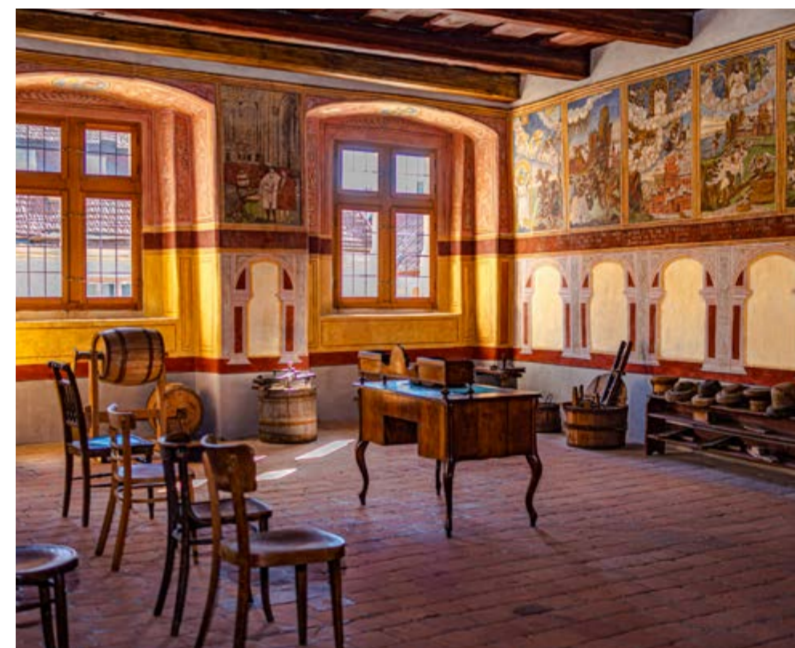
Interiér Domu U Giordanů. Místo, kde na Vás dýchá historie.