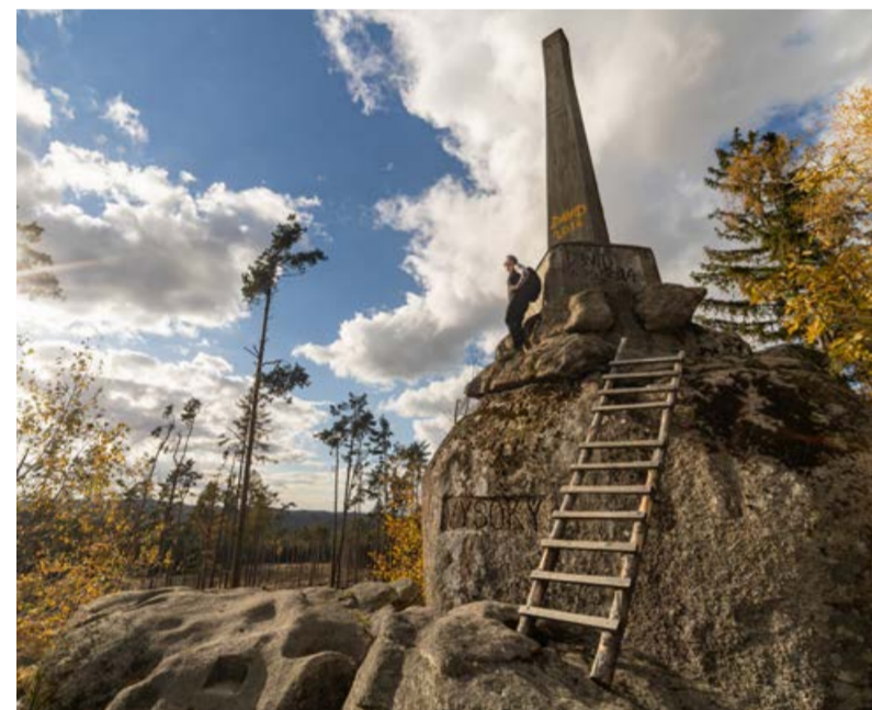
Vysoký kámen. Nejvyšší bod České Kanady.

gická místa a romantická zákoutí České Kanady a odnesete si spoustu nezapomenutelných zážitků. Pro snadnější zdolání 110 kilometrů stežka rozdělena do osmi etap tak, aby vždy na konci etapy nabíla ubytování či možnost snadné přepravy do většího města.