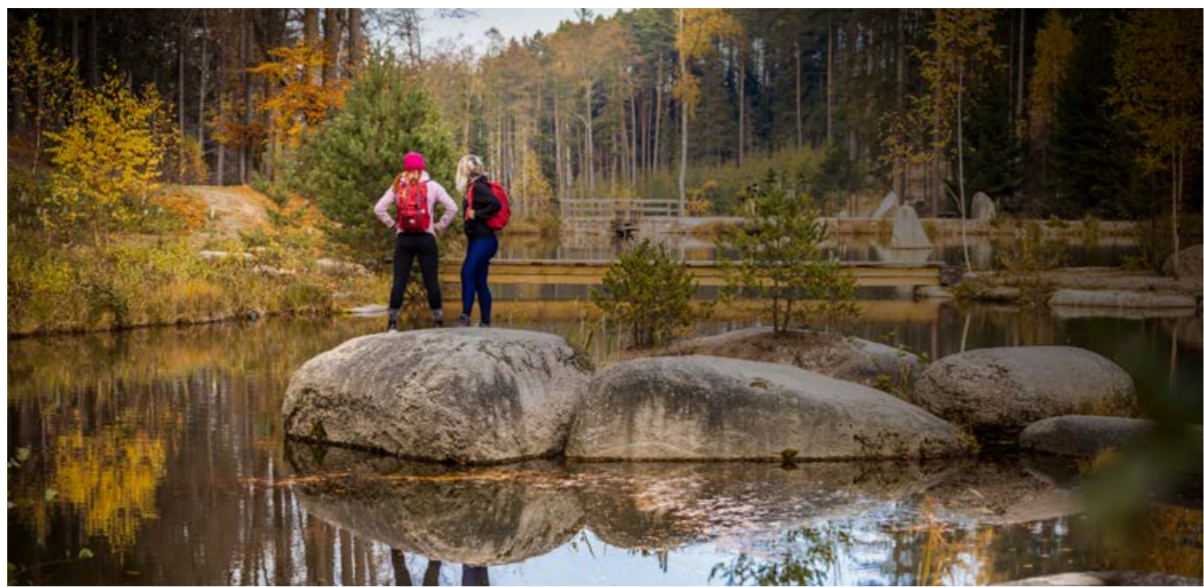
Kaskáda rybníků nedaleko rozhledny u Jakuba.

například kolem Kačležského a dál se nechte zavést do přírody České Kanady. Odtud už pár šlápnutí do pedálů a jste u Vysokého kamene, nejvyššího bodu České Kanady. Chcete navštívit legendární místo, kde leží Cimrman? Máte jedinečnou možnost, jste jen kousek od vlakové zastávky Kaproun, kde údajně Cimrman vyskočil z vlaku jako černý pasažér. Co by kámenem dohodil, jste u rybníku Zvůle, rybník obklopený drsnou přírodou České Kanady, kde je celé léto skvělé koupání. Tady je zapotřebí si odpočinout a načerpat síly, čeká Vás jízda krajinou typickou pro Českou Kanadou, přes Terežín. Nový Svět a dál do srdce této kra-