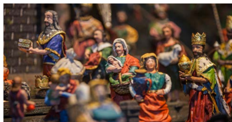
Krýzový jesličky. Největší lidový mechanický betlém najdete v muzeu Jindřichohradecka.

Výroba tapiserií má ve městě dlouholetou tradici a proslavila jej na počátku 20. století Marie Hoppe Teinitzerová. Stejně tak zajímavá je návštěva Muzea Jindřichohradecka s největším lidovým mechanickým betlémem na světě Krýzovými jesličkami nebo návštěva Muzea Meziobrádky s nejmenší brouzdalištěm pro nejmenší návštěvníky.