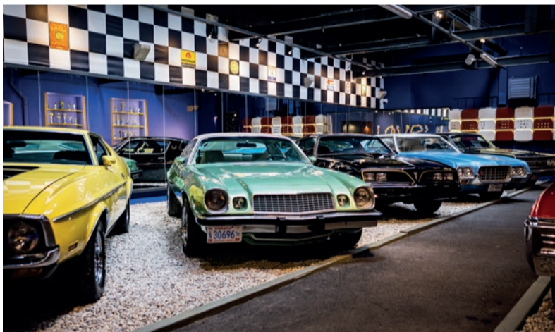
Muzeum veteránů každoročně překvapí novou expozicí.