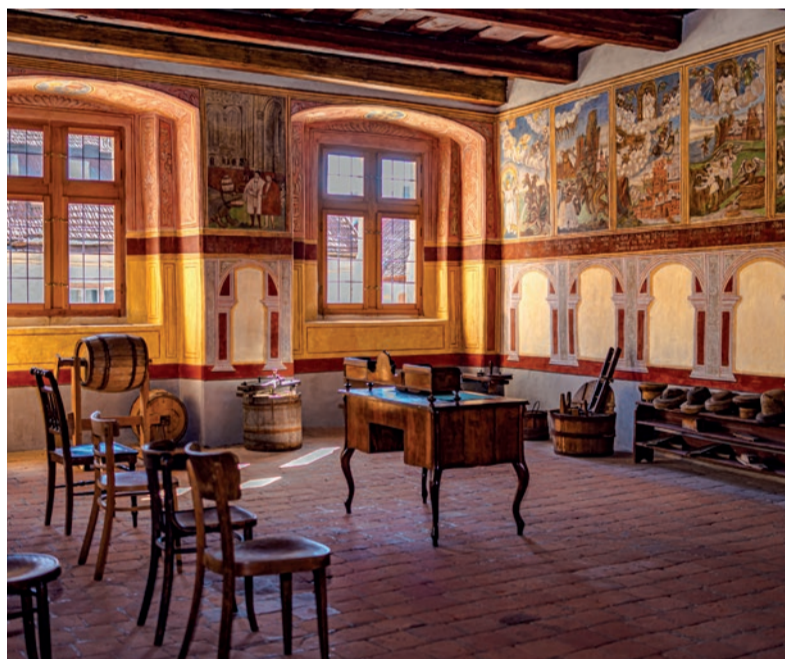
Interiér Domu U Giordanů. Místo, kde na Vás dýchá historie.