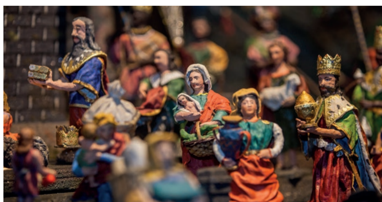
Krýzovy jesličky. Největší lidový mechanický betlém najdete v Muzeu Jindřichohradecka.

www.vkcjh.cz , www.mjh.cz www.zamek-jindrichuvhradec.cz