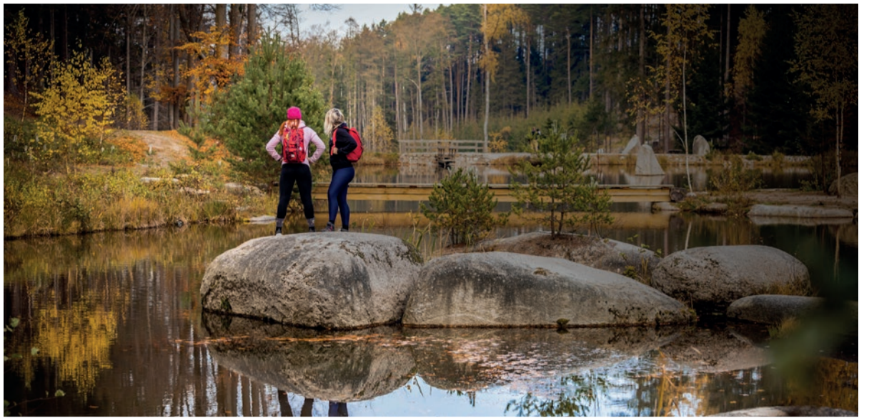
Kaskáda rybníků nedaleko rozhledny u Jakuba.

gická místa a romantická zákoutí České Kanady a odnesete si spoustu nezapomenutelných zážitků. Pro snadnější zdlání 110 kilometrů je stežka rozdělena do osmi etap tak, aby vždy na konci etapy nabízela ubytování či možnost snadné přepravy do většího města.