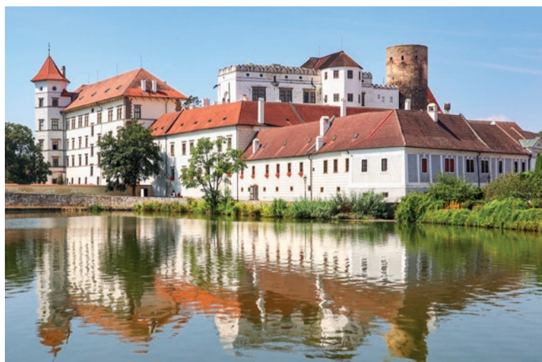
Pohled na zámek Jindřichův Hradec přes rybník Vajgar.