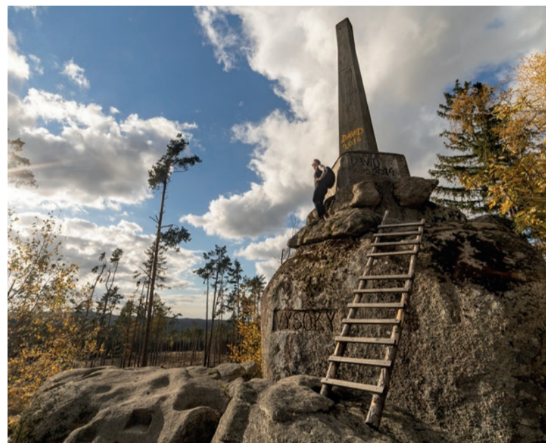
Vysoký kámen. Nejvyšší bod Jindřichohradecka.

Snímky z putování ze Stezky Českou Kanadou na sociálních sítích označujte: #stezkaceskoukanadou Těšíme se na vaše fotografie s tímto hashtagem.