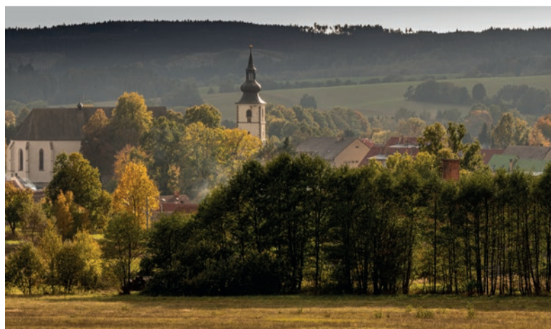
Staré Město pod Landštejnem.

Ze Starého Města se také můžete pěšky vydat na hrad Landštejn nebo objevovat přírodní krásy Hadího vrchu.