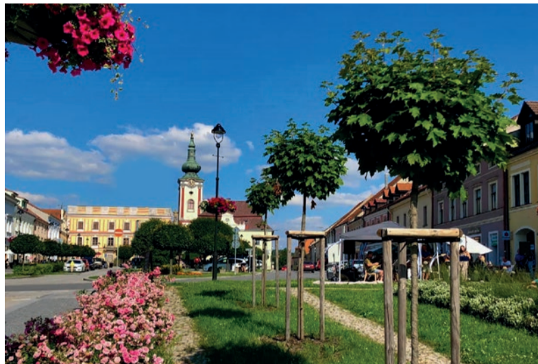
Nová Bystřice. Brána České Kanady.