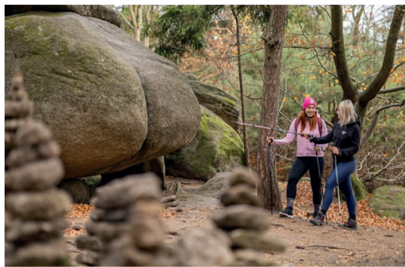
Skalní útvar Ďáblova prdel. Nejvyhledávanější balvan České Kanady.