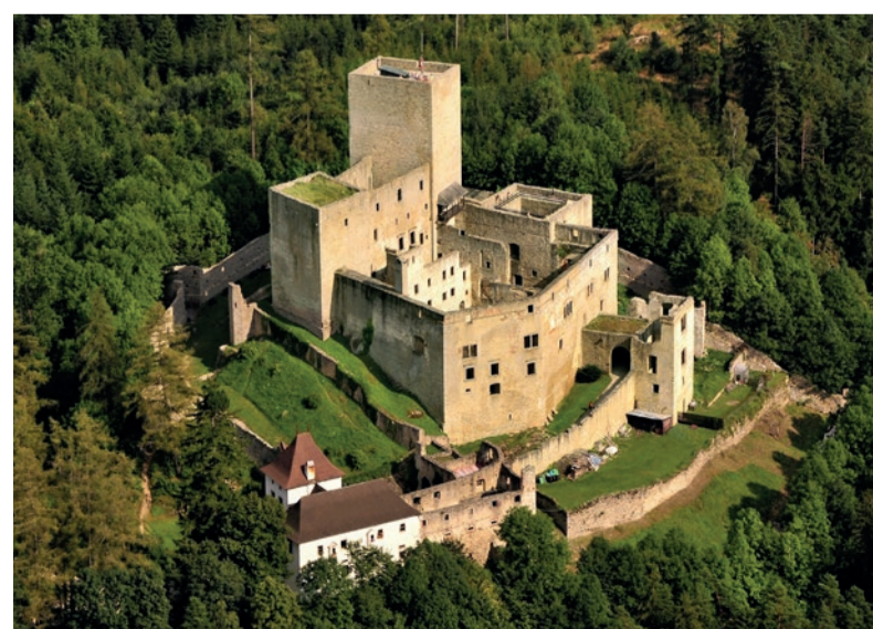
Hrad Landštejn. Dominanta, která krajinu střeží už několik století.

www.zamek-jindrichuvhradec.cz www.zamek-cervenalhota.cz www.zamek-dacice.cz www.hrad-landstejn.cz