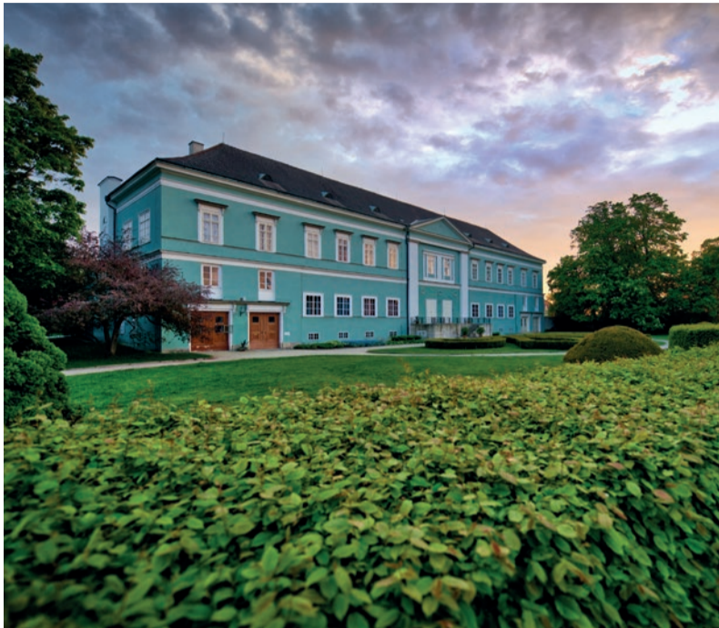
Státní zámek Dačice. Uvnitř zámku najdete nejen skvost.

V Dačicích objevíte malý žulový pomník kostky cukru nedaleko centra. V roce 1843 zde totiž byla vyrobena první kostka cukru na světě.