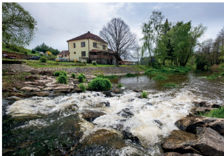
Spálený mlýn na Moravské Dyji.

Empírovou hrobku rodu Collatů (původních majitelů zámku v Písečném) z roku 1824 můžete obdivovat v nedalekých Nových Sadech. Autentickou náves Nových Sadů si zvolili filmaři pro natáčení některých scén filmu Po strništi bos.