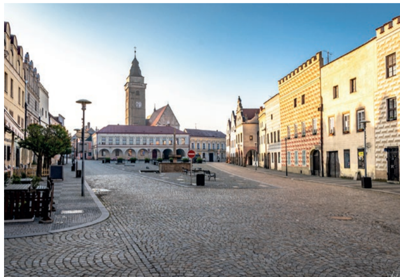
Slavonické náměstí. Renesanční perla České Kanady.

Ať přijedete objevovat historii, obdivovat památky, navštívit podzemí nebo městskou věž, nepamenejte, že všudypřítomná renesance není jen renesancí těla, ale také ducha. Zastavte se, odpočívajte, kochejte se a vychutnávejte atmosféru renesančních Slavonic.