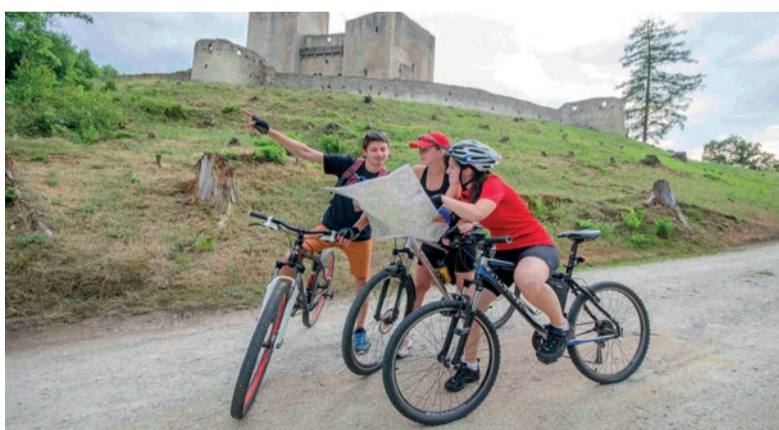
Cyklisté u hradu Landštejn.

Tady je zapotřebí si odpočinout a načerpat síly, čeká vás jízda kra-