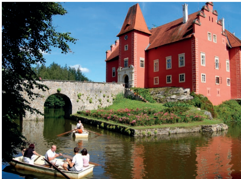
Zámek Červená Lhota.

Malá Hluboká, i tak je nazýván zámek v Českém Rudolci nedaleko Dačic. Budova zámku je poznamenána ne příliš příznivou historií, ale i přesto vás zámek zaujme. Průvodci vás rádi seznámí s historií, kterou zámek zažil. V blízkosti zámku se nachází zájezdní hostinec s vlastním pivovarem.